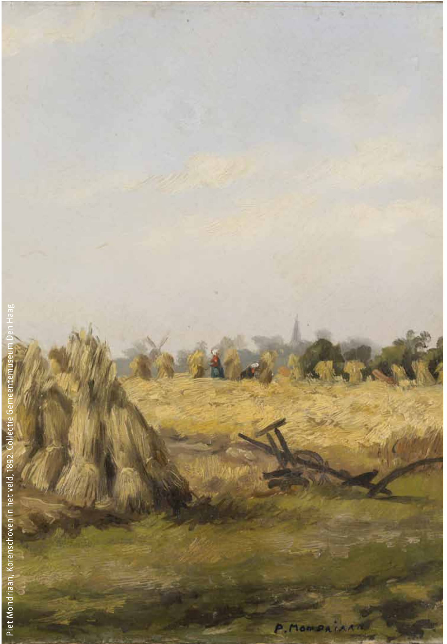
Piet Mondriaan, Korenschoven in het veld, 1892. Collectie Gemeentemuseum Den Haag