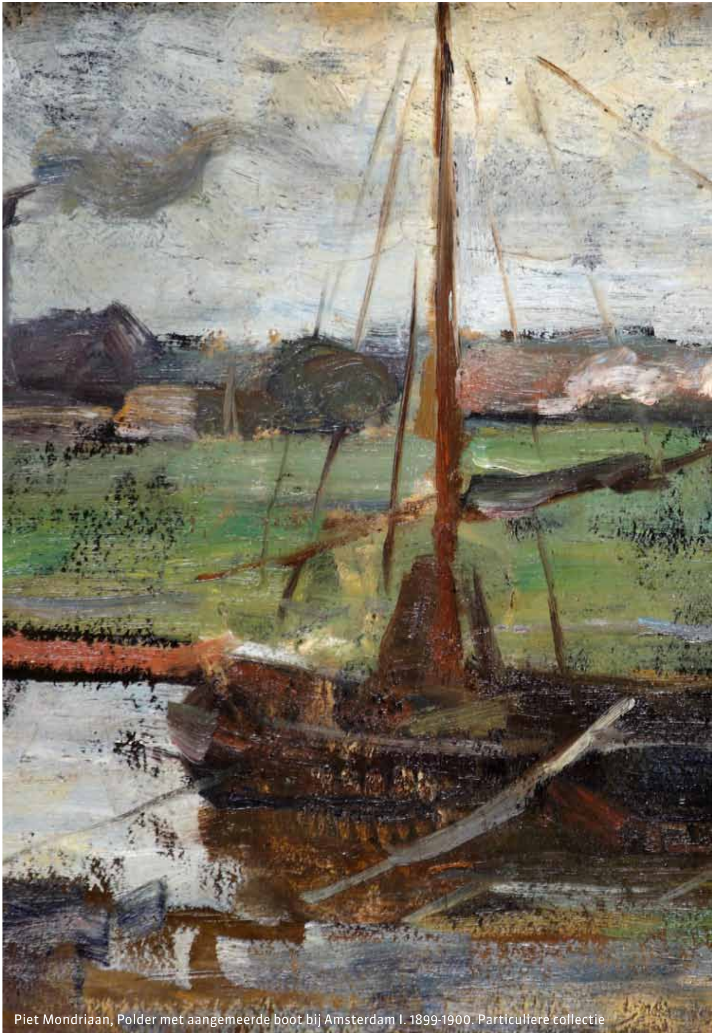
Piet Mondriaan, Polder met aangemeerde boot bij Amsterdam I. 1899-1900. Particuliere collectie